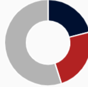
Numero interni edifici residenziali