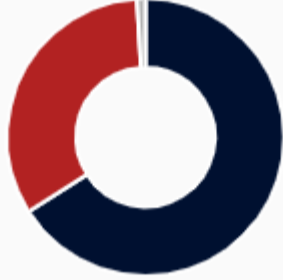
Altezza edifici residenziali